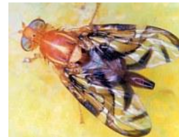
Moscas-das-frutas do gênero Anastrepha