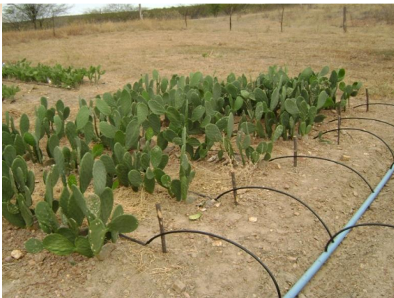
Palma adensada irrigada.