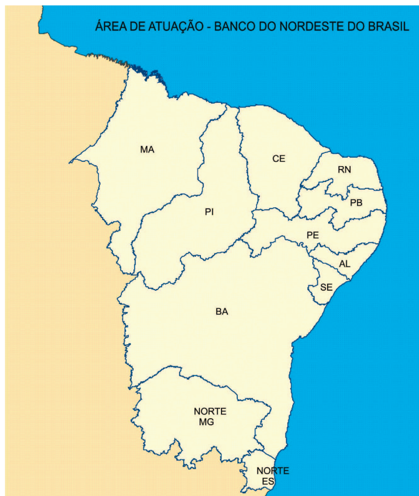
Mapa 1 – Área de Atuação – Banco do Nordeste do Brasil