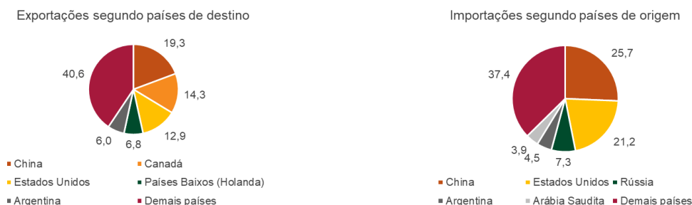
Gráfico 3— Principais países de destino e origem das exportações e importações— Nordeste – jan-mar/2026 – em %