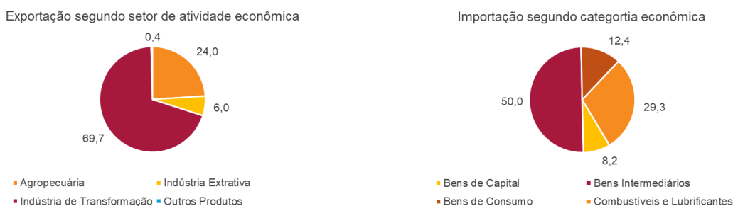
Gráfico 2 – Exportações e importações segundo setor de atividades e categoria econômica – Nordeste – jan-mar/2026 – em %

Fonte: Secex/MDIC (coleta de dados realizada em 08/04/2026). Elaboração BNB/Etene. Obs.: Dados referentes a meses anteriores sujeitos a retificação.