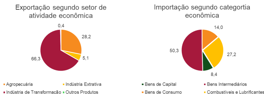
Gráfico 2 – Exportações e importações segundo setor de atividades e categoria econômica – Nordeste – jan-abr/2026 – em %

Obs.: Dados referentes a meses anteriores sujeitos a retificação.