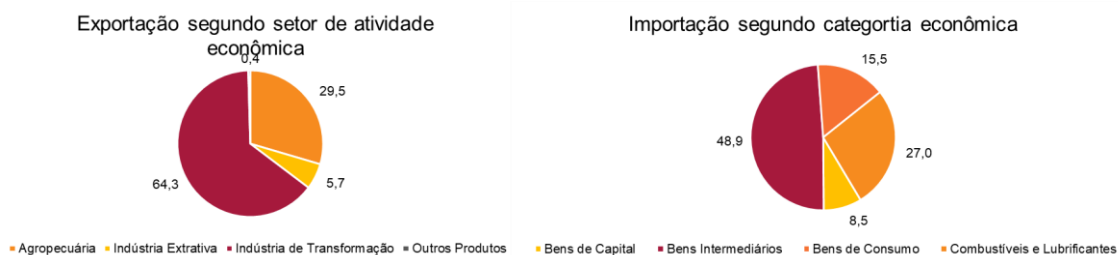
Gráfico 2 – Exportações e importações segundo setor de atividades e categoria econômica – Nordeste – jan-mai/2026 – em %

Obs.: Dados referentes a meses anteriores sujeitos a retificação.