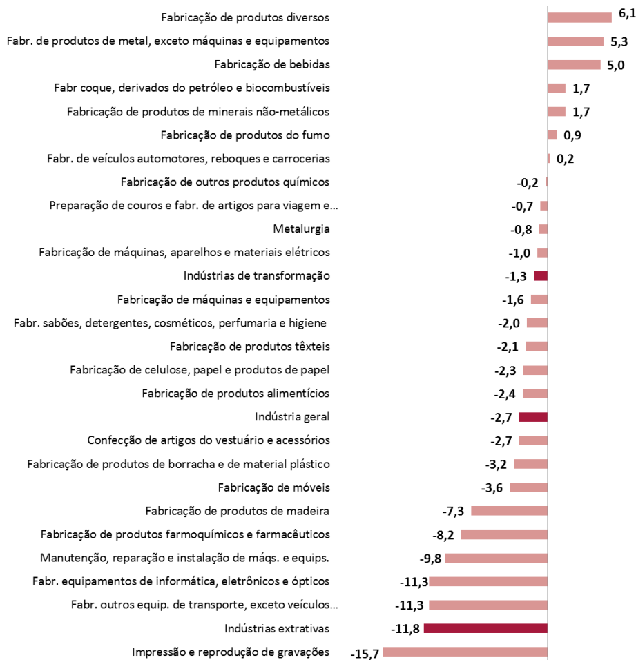
Gráfico 2 – Taxa de crescimento da produção industrial por seções e atividades (%) - Brasil - Acumulado janeiro a abril de 2019 (Base: igual período do ano anterior)